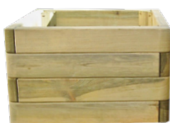
BAC DESIGN CARRÉ CL 3 0484 500 X 500 X 300 0483 400 x 400 x 300