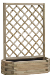
TREILLIS MODÈLE DROIT 0449 610 X 1000 0470 810 X 1200 0471 1010 X 1500

Idéal pour faire grimper des végétaux, sans fixation, à insérer simplement dans le bac