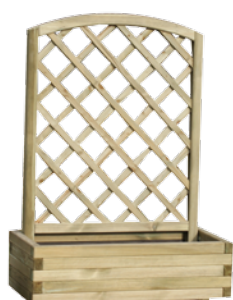
TREILLIS MODÈLE EN ARC 0472 610 X 1000 0473 810 X 1200 0474 1010 X 1500