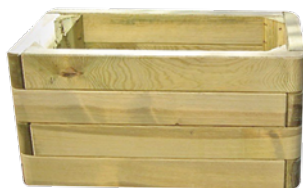
BAC DESIGN RECTANGULAIRE CL 3 0487 1000 X 500 X 300