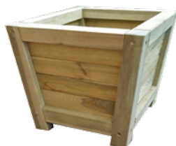
BAC DESIGN ÉVASÉ CL 3 0491 700 X 700 X 500