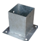
SUPPORT CARRÉ à visser

0001 90 x 90 x 150 mm 0002 70 x 70 x 150 mm